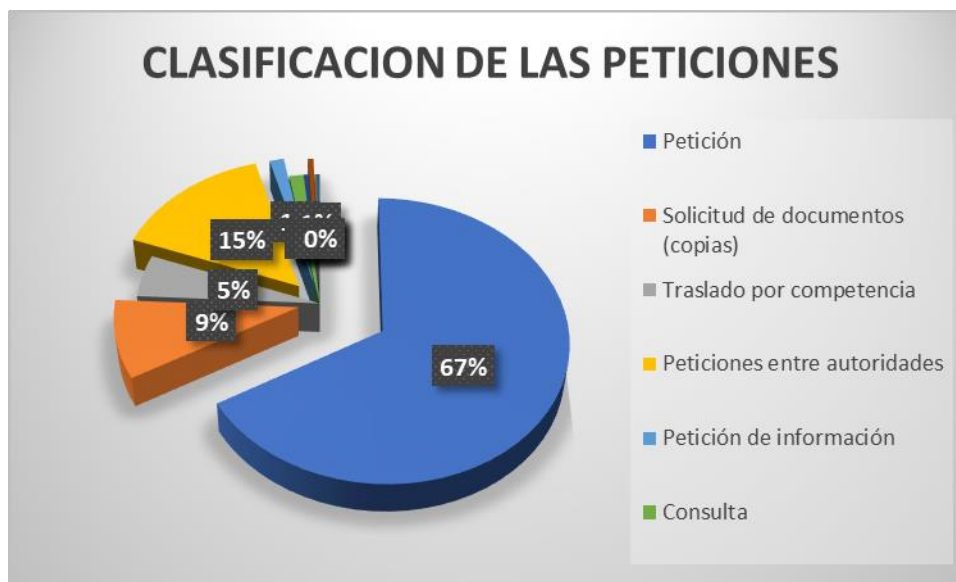
Gráfica No 2. Peticiones por modalidad.