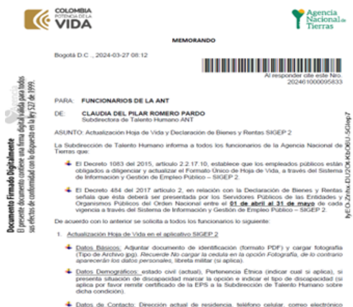
Imagen 1. Memorando solicitud de actualización hoja de vida y declaración de bienes y rentas.

Se adjunta memorando, banner enviado e instructivos del SIGEP 2.