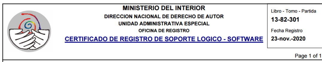
Imagen No 9. Certificado Derechos de Autor Klic

Es importante resaltar que, la Agencia Nacional de Tierras cuenta con el sistema de información de apoyo Administración de cuentas – KLIC, el cual tiene el registro de Derechos de Autor, donde se adjunta como soporte el certificado de registro de soporte lógico – software.