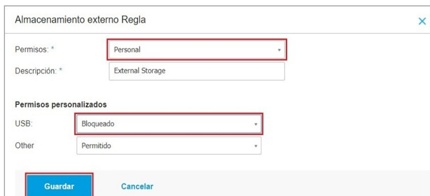
Imagen No 1. Bloqueo

4. De forma concreta, describa por favor cual es el destino final que se le da al software dado de baja en su entidad. (Máximo 300 caracteres).