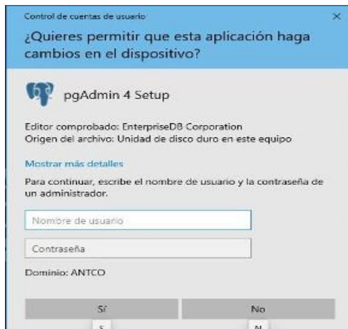
Imagen No 7. Control

En la verificación realizada por la OCI a las estaciones de trabajo en la sede CAN, se encontró que al intentar instalar un software o al hacer un cambio en el equipo, se activa una ventana, lo que confirma el funcionamiento del control de la no instalación de licencias no autorizadas.