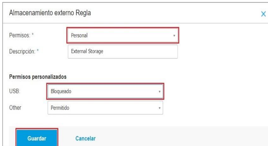
Imagen No 6. Bloqueo

la prevención de virus y otras amenazas informáticas que puedan ser transmitidas por este medio.